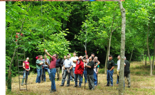
Réunion de formation forestière