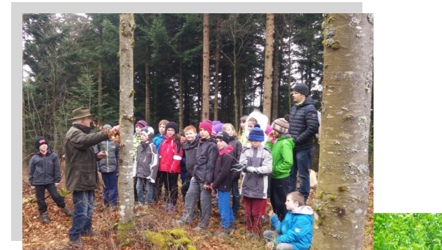
Forêt - école

1 groupe de 8 conseillers et 1 assistante en relation avec les entreprises, les collectivités et les élus locaux.