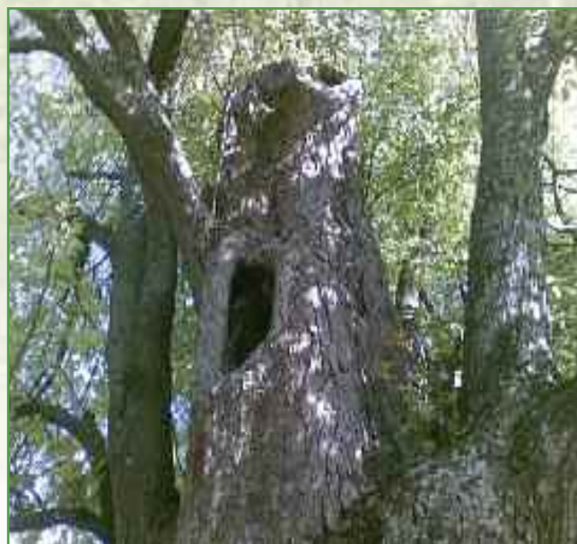
Cavité intéressante dans un gros tilleul