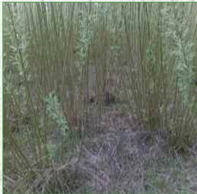
Taillis de saules à courte rotation

La problématique du bois-énergie est également dans tous les esprits. COSYLVAL se positionne comme fournisseur de bois ou de plaquettes forestières pour des chaufferies industrielles (Roquette SA à Beinheim ou STRACEL à Strasbourg, par ex.). La coopérative est aussi impliquée dans des