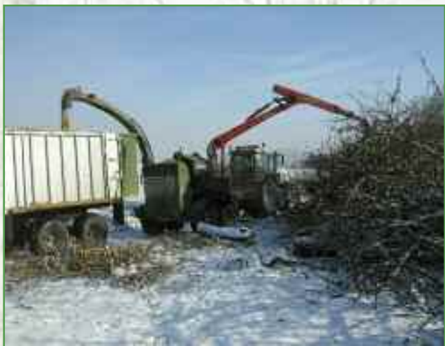
Broyage de rémanents et production de plaquettes forestières

réalise des prestations techniques pointues pour des clients non-coopérateurs (cartographie des forêts de la scierie SIAT-BRAUN, étude de ressource et de mise en place d'une filière bois-énergie pour la Communauté de Communes de la Haute-Bruche, ...).