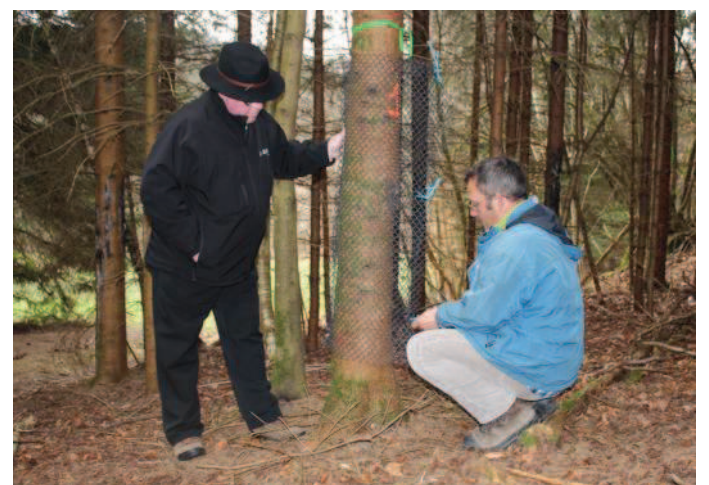
Les arbres sont grillagés pour les protéger des cerfs.