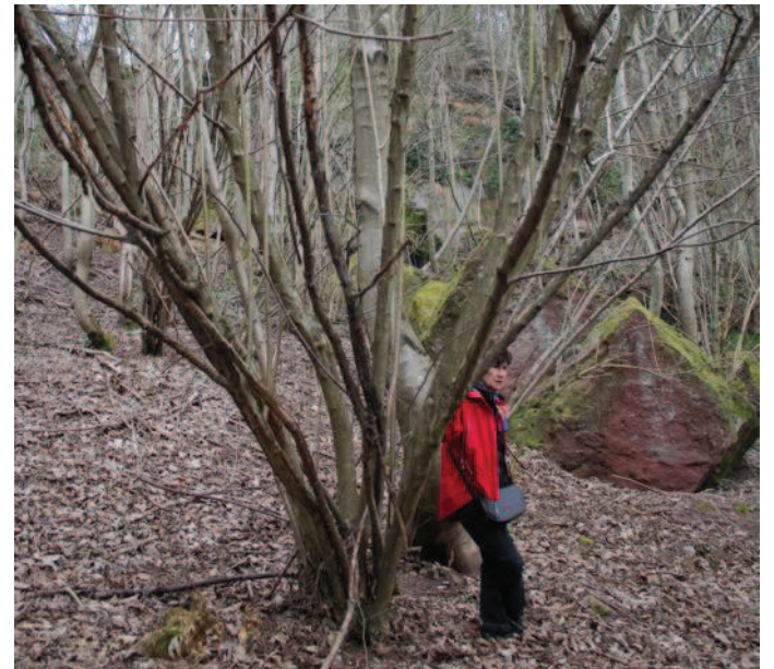
Sans intervention, les arbres poussent d'étranges manières.